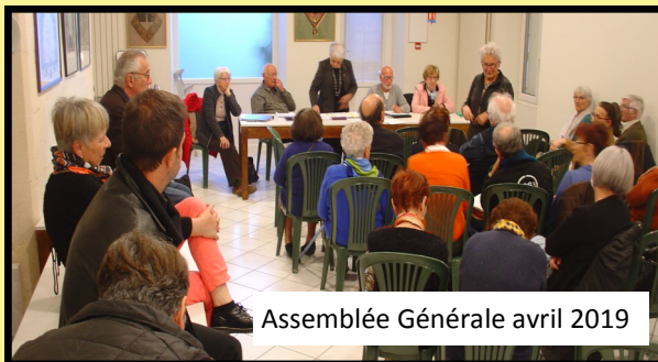
Assemblée Générale avril 2019

C'est hélas pour la deuxième fois depuis la création, il y a 17 ans, de notre association, que nous n'avons pas pu nous rendre à Tambaga. Comme vous le savez certainement, la situation est de plus en plus difficile et l'état d'urgence a été décrété depuis le 31 décembre 2018 dans 14 provinces du pays dont la province de la Tapoa dans laquelle se situe Tambaga. Si le danger semble moins grand dans la capitale, les déplacements dans les régions frontalières sont fermement déconseillés, aussi bien par les autorités françaises que burkinabé. Nous savons que beaucoup d'écoles ont été victimes d'exactions et tous craignent pour leur vie, celle des enseignants et des populations.